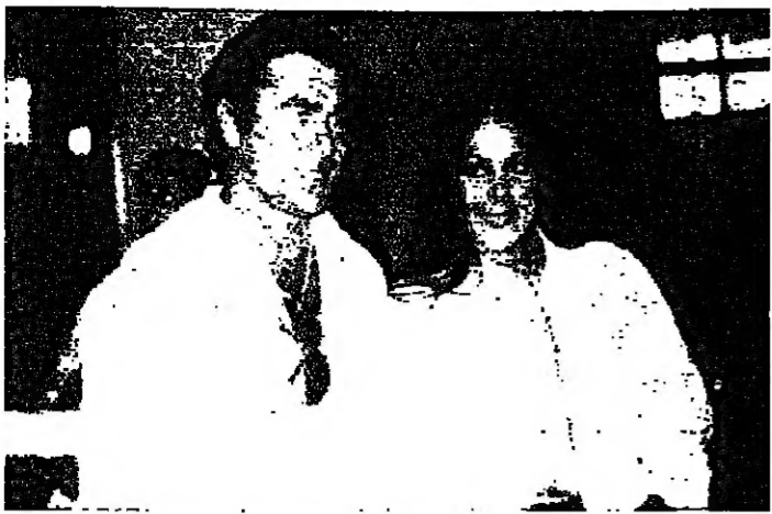
بيكيري، الويسيم، وزوجته. عشق كبير حتى لحظة الصراع الاخيرة